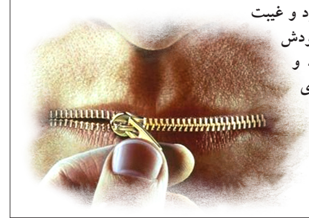
کتاب انسان کامل، ص ۲۸-۳۰

...انسان روزه بگیرد و غیبت کند، یعنی دهان جسم خودش را از غذای حلال ببندد و دهان روح خود را برای غذای حرام باز کند.