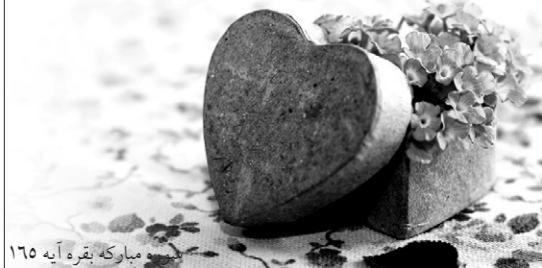
مبارک بقره آیه ۱۶۵

خب معلوم است که معشوق مشترک اگر بی‌نهایت باشد، عشق هم بی‌نهایت می‌شود. برای همین است که مومنین خانواده‌های بهتری دارند عموماً.