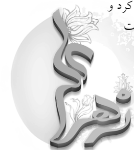
بحار الأنوار (ط - بیروت)، ج ۴۳، ص: ۳۹

جان‌ها به قربان این خانواده... میلاد این بانوی نازنین مبارک‌باد!