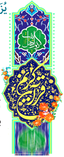
آل عمران، آیه ۱۶۴

لَقَدْ مَنَّ اللَّهُ عَلَى الْمُؤْمِنِينَ إِذْ بَعَثَ فِيهِمْ رَسُولًا مِنْ أَنْفُسِهِمْ يَتْلُوا عَلَيْهِمْ آيَاتِهِ وَ يُزَكِّيهِمْ وَيُعَلِّمُهُمُ الْكِتَابَ وَالْحِكْمَةَ