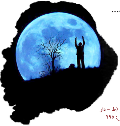
الأصول السنة عشر (ط - دار الحدیث)، ص: ۲۹۵