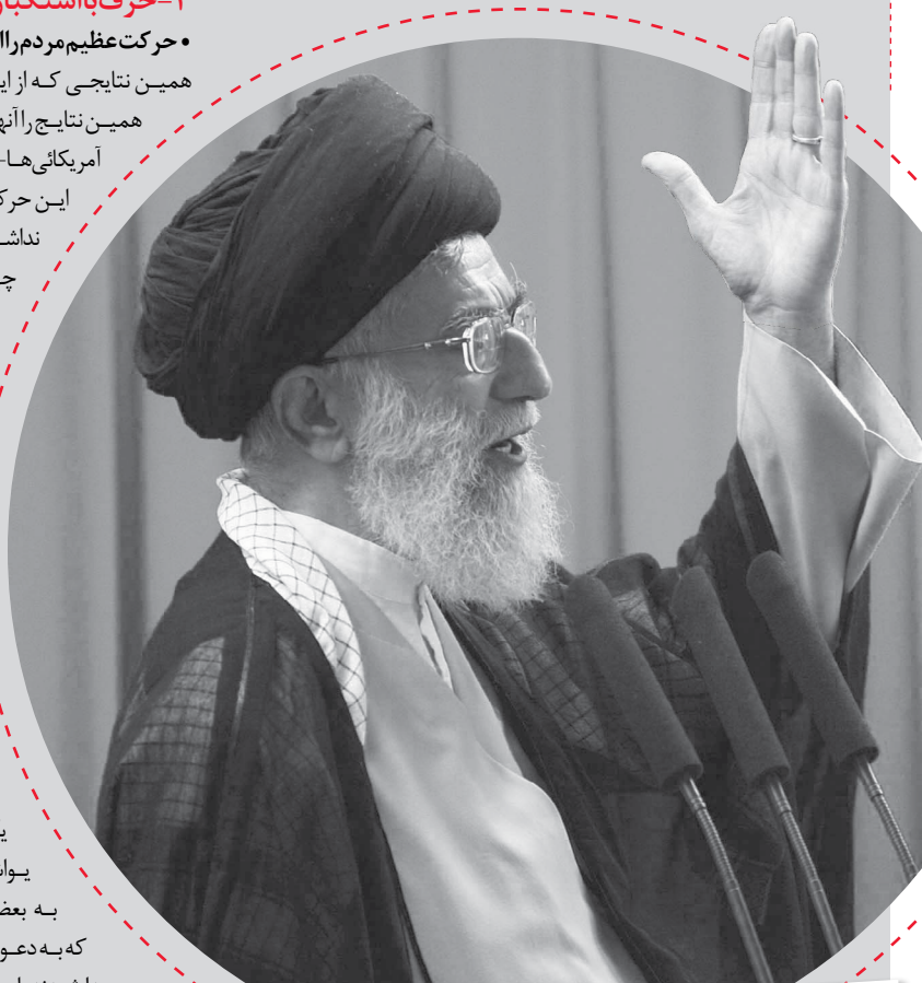
بازخوانی بیانات رهبر انقلاب در خطبه تاریخی ۲۹ خرداد ۸۸

یک سرمایه‌دار صهیونیست آمریکایی چند سال قبل از این، طبق ادعای خودش که در رسانه‌ها و در بعضی از مطبوعات نقل شد، گفت من ده میلیون دلار خرج کردم، در گرجستان انقلاب مخملی راه انداختم... احمق‌ها خیال کردند جمهوری اسلامی، ایران و این ملت عظیم هم مثل آنجاست. مشکل دشمنان ما این است که هنوز هم ملت ایران را نشناختند.