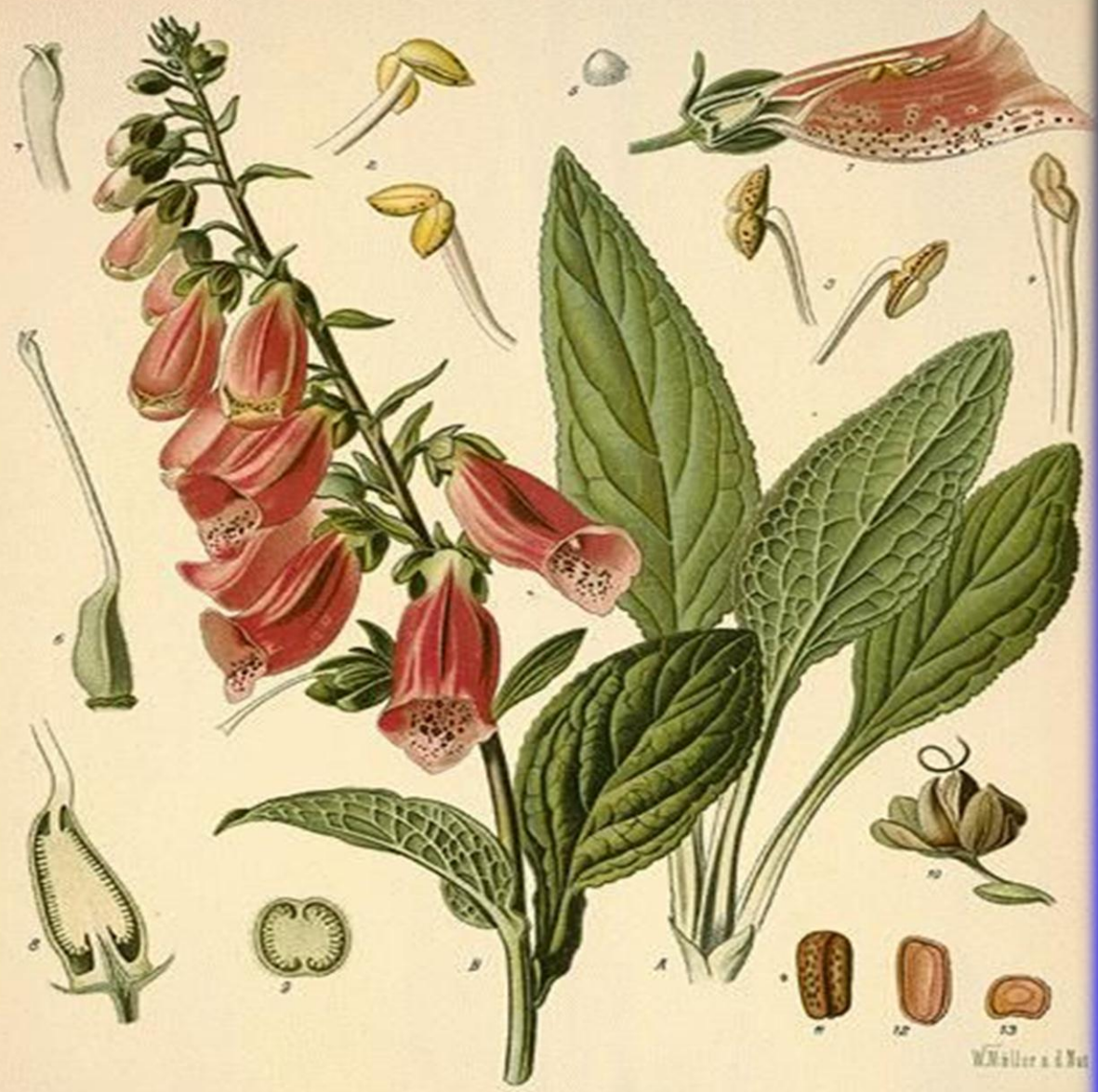
Digitalis purpurea L.