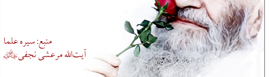
منبع: سیره علما آیت‌الله مرعشی نجفی (ع)

آن موقع حمام خانگی رایج نبود و مردم از حمام عمومی استفاده می‌کردند و دلاک‌ها هم معمولاً ریش بلندی داشتند و سرشان را می‌تراشیدند؛ روزی مرحوم آیت‌الله مرعشی که وارد حمام عمومی می‌شوند و از قضا تعدادی مسافر مشغول شست‌وشوی خود در حمام بودند، فکر می‌کنند ایشان دلاک است. یکی با تحکم می‌گوید: «دلاک چرا دیر کردی؟! ما عجله داریم.» ایشان بدون این که چیزی بگوید، مشغول کیسه کشیدن آن‌ها می‌شود. یکی از آن‌ها می‌گوید، اوستا خوب بلد نیستی کیسه بکشی! در این حین دلاک اصلی وارد می‌شود و آقا را در این حال می‌بیند، از ایشان معذرت می‌خواهد آن مسافر نیز متوجه اشتباه خود می‌شود و از آیت‌الله مرعشی عذرخواهی می‌کند. آقا می‌گوید: «زائر حضرت معصومه (ع) هستند، اشکال ندارد.»