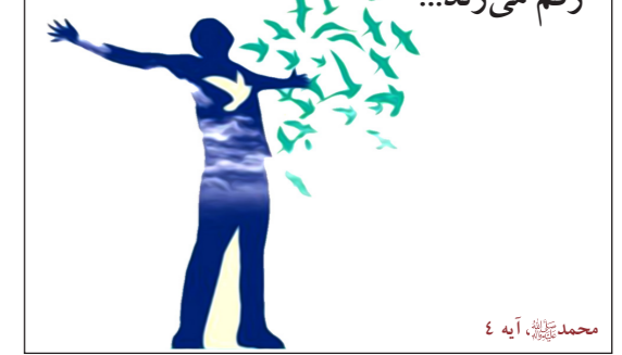
محمد ﷺ، آیه ۴