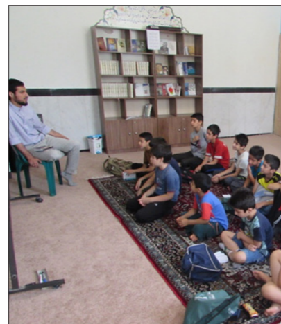
• داستان شیرین راستان! کلاسی سرشار از اعتقادات.