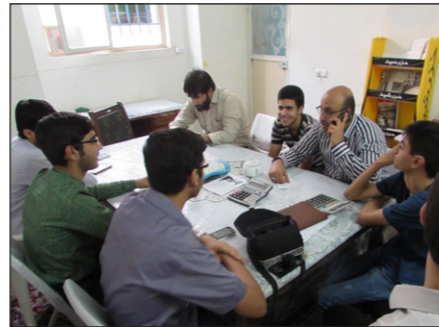
• جلسات فشرده برنامه ریزی با حضور نوجوانان