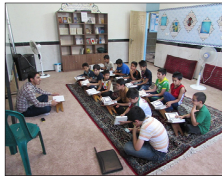
• کلاس روخوانی و روانخوانی قرآن