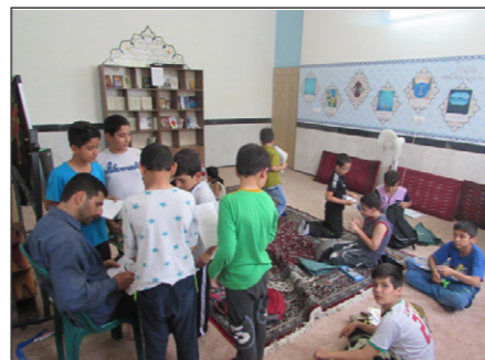
• کلاس جذاب کاریکاتور هم مشتری‌های خاص خودشو داره