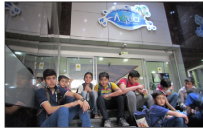
• طرح با اردوی دهکده آبی پارس و استقبال بچه‌ها عملاً آغاز به کار کرد.

گزارش تصویری از اتفاقی که تابستان امسال در مسجد دارد می‌افتد: طرح جوانه‌های صالحین که به همت پایگاه بسیج شهید صدر و کانون فرهنگی مسجد در حال اجراست. گوشه‌ای از برنامه های طرح را برای شما به تصویر کشیده‌ایم: