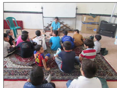
• احکام هم بخشی از کلاس‌های طرح است.