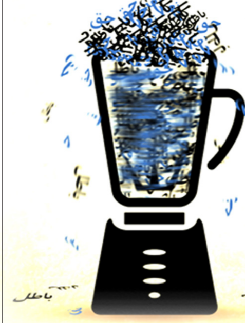
شهید مرتضی مطهری، کتاب جاذبه و دافعه علی علیه السلام ، ص ۱۱۸، ۱۲۰

اصولی و اصول‌شناس، هم دین‌دار و هم دین‌شناس... این صحیح نیست که تو اول شخصیت‌هایی را مقیاس قرار دهی و بعد حق و باطل را با این مقیاس‌ها بسنجی... اشخاص نباید مقیاس حق و باطل قرار گیرند. این حق و باطل است که باید مقیاس اشخاص و شخصیت آنان باشند.