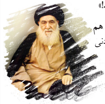
منبع: منبرک آیت‌الله سید ابوالقاسم خوئی

می‌فرماید: «نیازی به پیام نیست. ارسال هم شود، جوابی نخواهم داد!» شجاعت مثال‌زدنی آقا، فرستاده پادشاه را به شگفتی آورد.