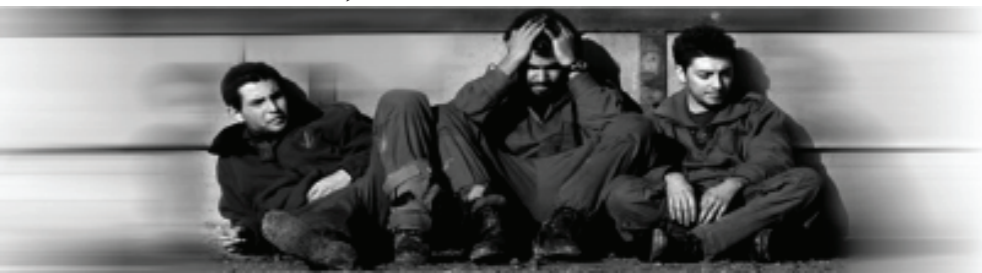
توضیح المسائل امام، مسئله ۲۱۲۴

فَإِنَّ حِزْبَ اللَّهِ هُمُ الْغَالِبُونَ