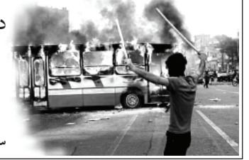
سوره شعرا، آیه ۱۸۷

حالا باور می‌کنیم که چطور برخی در کربلا امام‌شان را کشتند و پیروان‌شان در فتنه ۸۸ جامعه اسلامی را به آشوب کشیدند و هنوز هم که هنوز است، از زشت‌کاری‌های خود دفاع می‌کند.