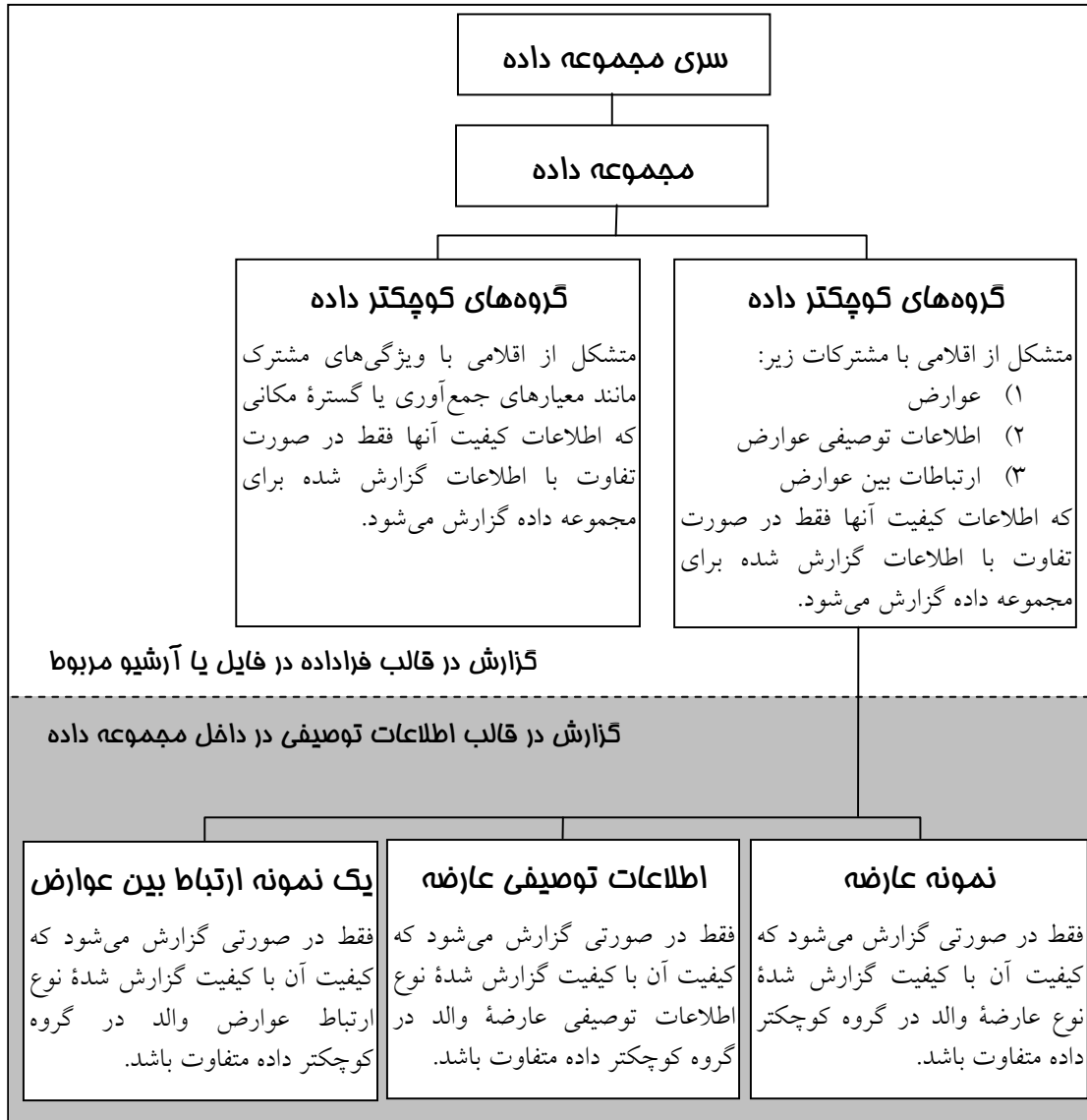
شکل ب-۲: روش پیشنهاد شده برای گزارش اطلاعات کمی کیفیت در قالب فراداده