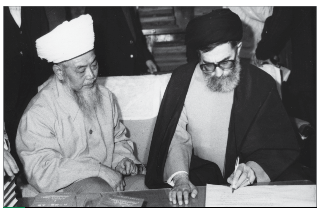
حضور آیت‌الله خامنه‌ای در یکی از مساجد پایتخت چین، یکن | سال ۶۸

الظلمات إلى النور» آنهایی که «اللَّهُ وَلِيُّ الَّذِينَ آمَنُوا يُخْرِجُهُمْ مِنَ الظلماتِ إِلَى النُّورِ» همین سَمَتِ معلمی است. خدای تبارک و تعالی این سَمَتِ را به خودش نسبت می‌دهد که خدای تبارک و تعالی وَلِيٌّ مومنین است؛ و آنها را از ظلمات اخراج می‌کند به سوی نور. و معلم اول خدای تبارک و