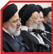
عضو هیئت رئیسه مجلس خبرگان رهبری

حجت‌الاسلام رئیسی از جمله مدیرانی است که در طول دوران مسئولیت خود تاکنون از حمایت حداکثری علما و صاحب‌نظران برخوردار بوده است. انتخاب ایشان به عنوان یکی اعضای هیئت رئیسه مجلس خبرگان رهبری، گواهی بر این مدعاست. پویش‌های دعوت از ایشان به عنوان کاندیدای انتخابات ریاست جمهوری از طرف بزرگان و معتمدین مردم نیز خود نشانی از اعتماد به ایشان است.