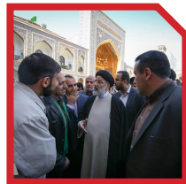
اقدامات تحول‌گرایانه در آستان قدس رضوی

فعالیت‌های آستان قدس رضوی و جمع‌آوری بیش از ۱۰۰۰ نظر، ایده و طرح، توجه به بانک‌های اطلاعاتی و افزایش شفافیت‌داری‌ها و موقوفات آستان، تعیین تکلیف تعداد ۱۰۰۰ پرونده و چک‌های بدهکاران، رفع مشکل کارگران شاغل در کارخانه‌های وابسته به آستان قدس، تشکیل مجمع عمومی همه شرکت‌ها و مؤسسات اقتصادی بعد از سال‌ها تأخیر، چابک‌سازی، بازمهندسی و کاهش تصدی‌گری و پرهیز از رقابت با مردم و بخش خصوصی در فعالیت‌های اقتصادی، استقرار نظام حسابرسی داخلی و بازرسی و برکناری قائم مقام آستان قدس و ارسال پرونده به دادگاه در ابتدای قبول مسئولیت توسط دکتر رئیسی، نمونه‌هایی از اقدامات تحول‌گرایانه در آستان قدس رضوی بوده است.