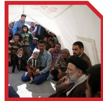
حضور به موقع در صحنه حوادث و مدیریت بحران‌ها

۳۵ حضور به موقع در صحنه حوادث و مدیریت سریع و صحیح در بحران‌ها از نکات برجسته در عملکرد دکتر رئیسی محسوب می‌شود. ابراز هم‌دردی با زائران حادثه قطار تبریز- مشهد در ساعات نخست، تاکید بر تسریع در روند درمانی حادثه دیدگان و سرکشی و دلجویی با مجروحان و خانواده‌های عزادار و تقدیم هدایای متبرک استان مقدس امام رضا (ع)، نمونه‌ای از حضور به موقع و اثرگذار او در صحنه است.