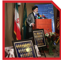
پیشنهاد نظارت مجازی