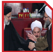
پیگیری مشکلات مردم