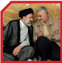
اعتماد به آمریکا

۳۲ حجت‌الاسلام رئیسی استکبارستیز و دشمن‌شناس است. ایشان به واسطهٔ سال‌ها حضور در سنگرهای مبارزه با دشمنان داخلی و خارجی یک دشمن‌شناس متبحر شده است و این تبحر را در کلام ایشان می‌توان یافت که در یکی از سخنرانی‌هایش گفت: «فتنه امروز، اعتماد به آمریکاست».