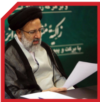
در آستان قدس رضوی اولین اقدامش، شفافسازی مالی آستان بود.

۲۶ دکتر رئیسی قائل به شفافیت مدیریتی و مالی در مجموعه‌ی تحت مدیریتش است. سه سالِ پیاپی نمایشگاه بزرگی برگزار نمود که در آنها از رؤسای سه قوه گرفته تا سایر مسئولین لشکری و کشوری، همگی از تحول در سازمان و نقش اثرگذار آن سخن گفتند.