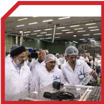
روش تخصصی و فعال

۳۰ کار علمی و کارشناسی شده را در اولویت قرار می‌دهد. نظارت و بررسی را از روش سنتی و انفعالی به روشی تخصصی و فعال ارتقاء بخشید و این یکی از نوآوری‌های ایشان در عرصه‌ی مدیریت بود، و برای تحقق آن، از صاحب‌نظران و اساتید برجسته دانشگاه‌های کشور بهره گرفت.