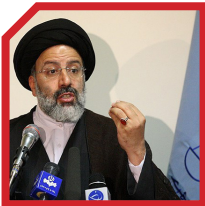
خدمات فراوان در دستگاه قضایی کشور

دکتر رئیسی در دوران مسئولیت خود در قوه قضاییه پایه‌گذار اقدامات مختلفی در راستای افزایش بهره‌وری دستگاه قضا برآمد. کاهش اطاله دادرسی، راه‌اندازی کارگروه حمایت از سرمایه‌گذاران اقتصادی، احیای صدها بنگاه تولیدی و جلوگیری از ورشکستگی آنها و برکناری بیش از ۳۰۰ قاضی متخلف از مجموعه اقدامات مؤثر رئیسی در قوه قضاییه بوده است.