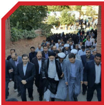
منتقد تهران زدگی

منتقد تهران زدگی است. او اعتقاد دارد باید تمرکز از پایتخت و مراکز استان‌ها برداشته شود و اتکا به سازوکارهای تصمیم‌گیری استانی و منطقه‌ای باشد. تایید این نگاه راه‌اندازی دفاتر سازمان بازرسی در تمام استان‌های کشور است.