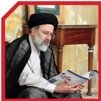
برنامه راهبردی ۵ ساله

۲۸ اهل برنامه‌ریزی‌های راهبردی و ارزیابی‌های کلان است. در سازمان بازرسی برای اولین بار نظام برنامه‌ریزی را تحت قالب ۲ برنامه راهبردی ۵ ساله تدوین کرد. اجرای این برنامه‌ی راهبردی چنان تحولی ایجاد کرد که بعد از اتمام آن، رهبری فرزانه انقلاب، به‌صورت ویژه از این ابتکار عمل و برنامه‌ریزی، تجلیل کردند.