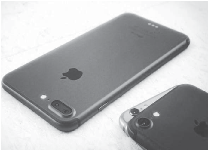
آیفون ۷ در کنار نسخه ۷ پلاس