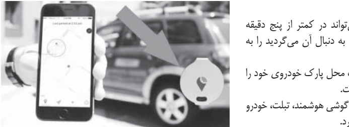
تراک ر، یک ردیاب کوچک خودروی شما را به شما نشان می‌دهد.