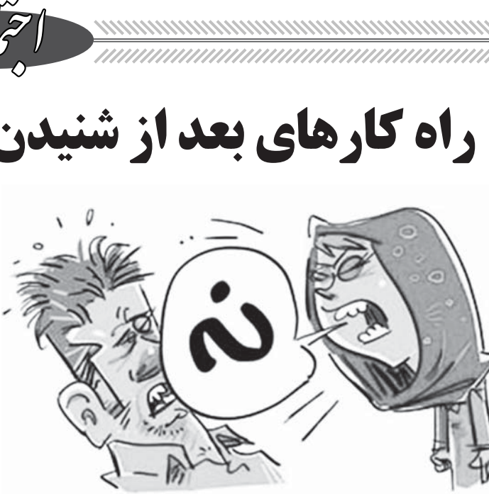
راه کارهای بعد از شنیدن جواب رد در خواستگاری

ابتدا به روش بن ماری شکلات های مورد نظرتان را آب می‌کنید و به دور تا دور کاسه می‌چسبانید بستنی را یک تادو دقیقه می‌گذارید آب‌شود و خامه را با آن مخلوط می‌کنید و اگر می‌خواهید به آن میوه بزیند از قبیل میوه ها را با همان یک قاشق سوپ خوری شیر و خامه مخلوط کنید و بعد بستنی را اضافه کنید. اگر احساس کردید خیلی سفت شده کمی شیر به آن اضافه کنید ولی زیاد تزئید که بستنی شل و آبکی شود.