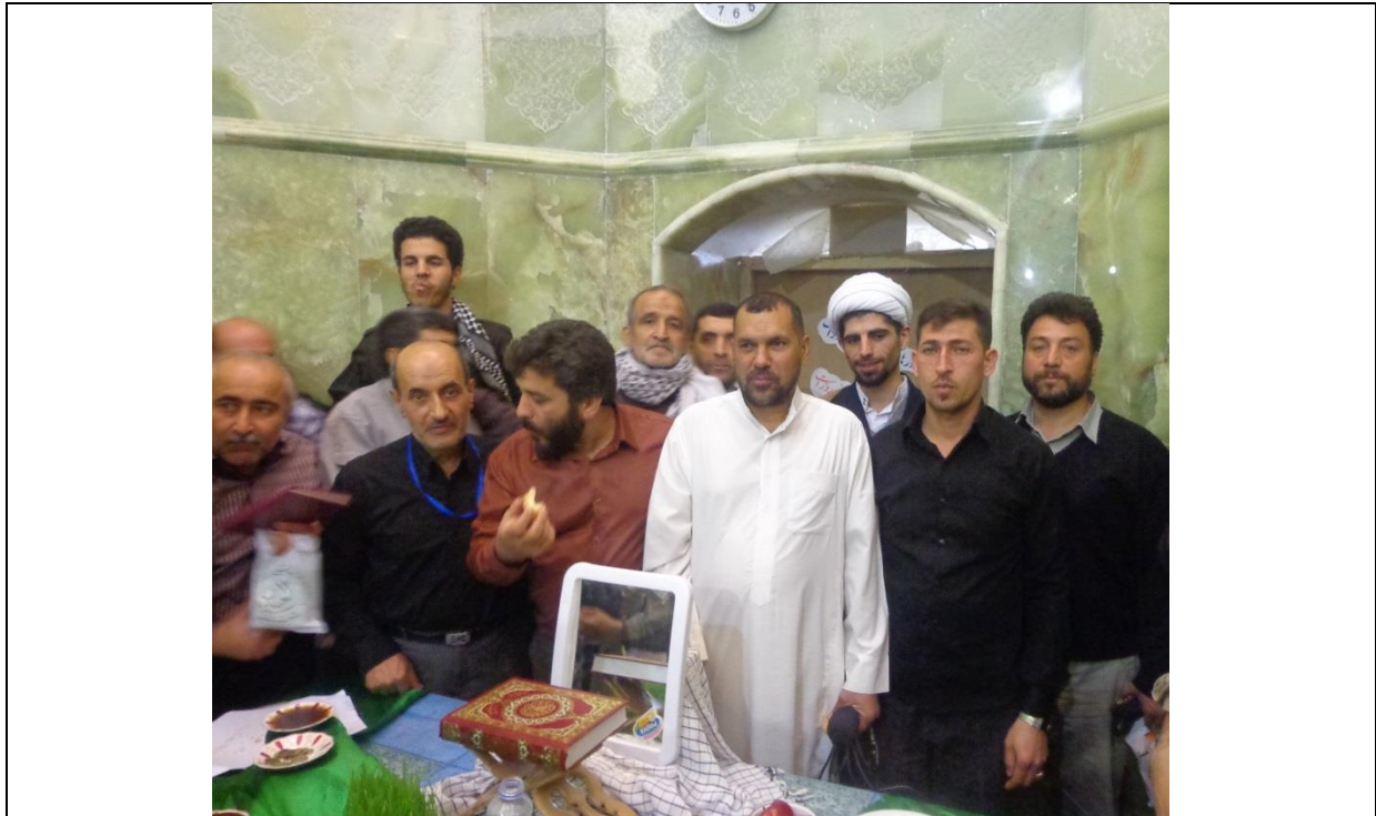
برنامه لحظه تحویل سال ۱۳۹۳