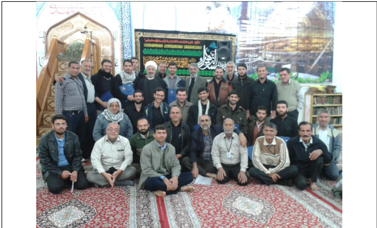
جلسه وداع دانشجویان و عکس یادگاری با شیخ حیدر یعقوبی