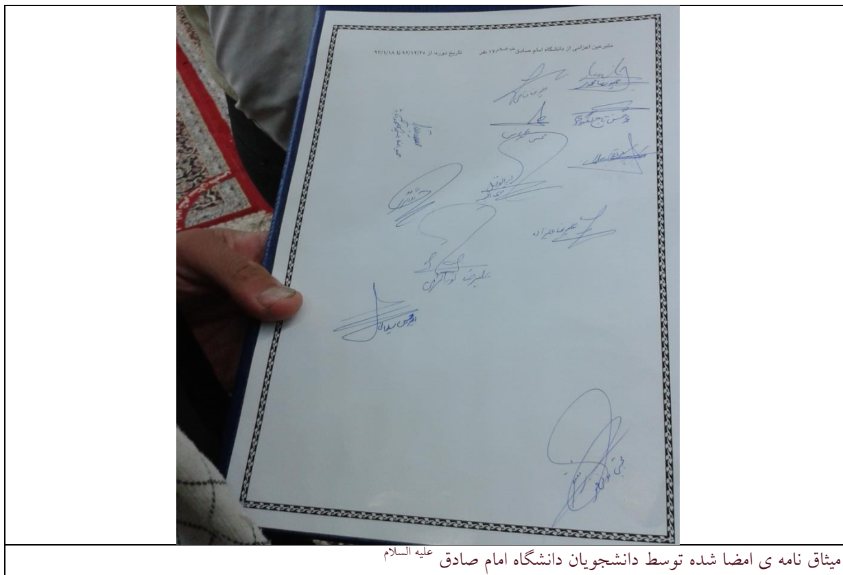
میثاق نامه ی امضا شده توسط دانشجویان دانشگاه امام صادق علیه السلام