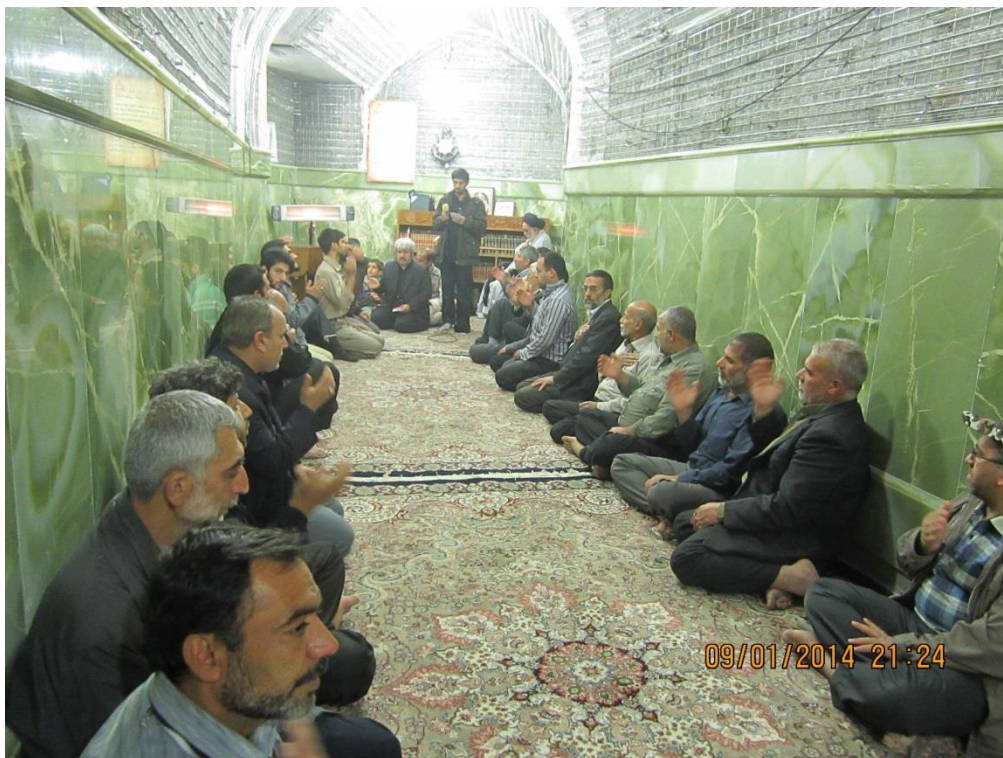
هیئت شبانه در سرداب