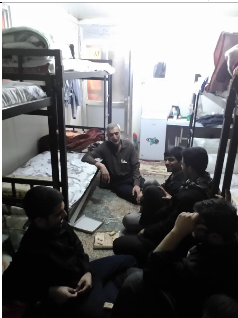
عید نوروز و سنت حسنه بازدید بزرگترها

عید نوروز بود و همگی مهمان خانه حجت ابن الحسن العسکری عجل الله تعالی فرجه الشریف بودیم، گفتیم از بهترین آداب و رسوم ایرانیان در عید نوروز که مورد تأکید اسلام است، دید و بازدید و صلح رحم است که در آن معمولا کوچکترها به دیدن بزرگترها می روند. به همین مناسبت برخی شب ها با اتاق بزرگترهایی مثل استاد کار مقرنس یا مسئولین ستاد و... می رفتیم و ضمن تبریک عید گفت و گویی غیر رسمی و خودمانی با آنها داشتیم. این کار فضای نسبتاً رسمی کاری را شکست و بیشتر صبغه صمیمیت و رفاقت را حکم فرما می نمود.