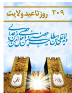
دریافت کد روز شمار غدیر