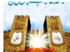
دریافت کد روز شمار غدیر