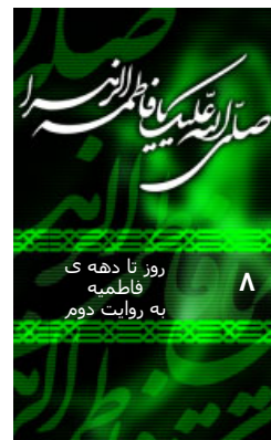
دریافت کد روز شمار فاطمیه