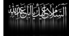
دریافت کد روز شمار محرم

در زندگی هر يك از ما گاهی بر سر دو راهی قرار می گیریم و بعد از مشورت با دیگرانم و زدن تمامی درها اگر نتوانستیم راه خودمان را انتخاب کنیم به استخاره روی می آوریم و از خداوند طلب خیر میکنیم .