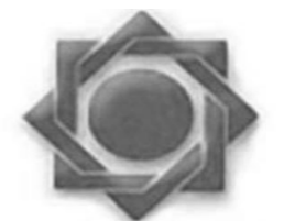
بانک مرکزی جمهوری اسلامی ایران