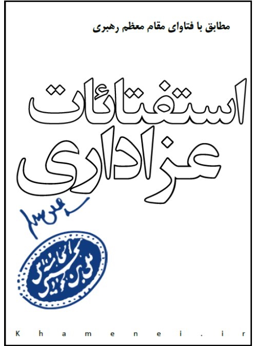
جزوه استفتائات عزاداری