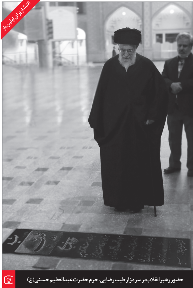
حضور رهبر انقلاب بر سر مزار طیب رضایی، حرم حضرت عبدالعظیم حسنی (ع)

عزیزان من! آنچه مهم است این است که این پیشرفت علمی که در کشور از حدود دو دهه‌ی قبل به این طرف شروع شده، ادامه پیدا کند. مادر برخی از رشته‌های علمی نوپا در رتبه‌های بالای جهان هستیم؛ یعنی ارتبه‌های زیر ده، رتبه‌ی پنجم، ششم، هفتم، هجدهم، بیستم، سی و پنجم، اما این کافی نیست؛ حرکت علمی در دنیا یک حرکت پُر شتابی است، ما هم عقب‌ماندگی‌های بسیار ممتزکمی از سابق داریم، لذا بایستی این شتابی که در پیشرفت علمی هست ادامه پیدا کند. ۹۸/۷/۱۷