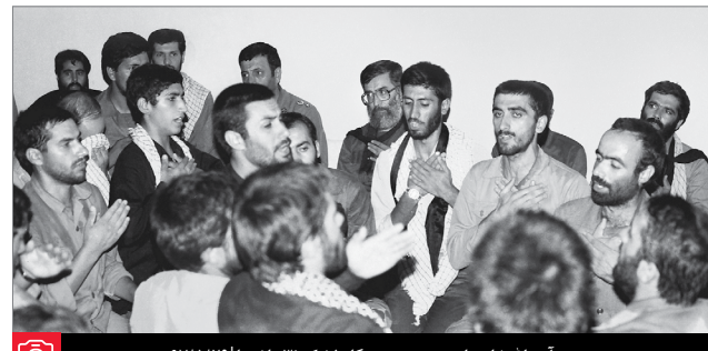
آیت‌الله خامنه‌ای در جمع رزمندگان لشکر ۳۱ عاشورا ۶۷/۵/۲۹

که مبدا پیروزی ما شد، برای خاطر این مجالس عزای این مجالس سوگواری و این مجالس تبلیغ و ترویج اسلام شد. سید مظلومان یک وسیله‌ای فراهم کرد برای ملت که بدون اینکه زحمت باشد برای ملت، مردم مجتمع‌اند... حضرت سیدالشهدا از کار خودش به ما تعلیم کرد که در میدان وضع باید چه جور