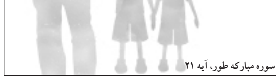
سوره مبارکه طور، آیه ۲۱