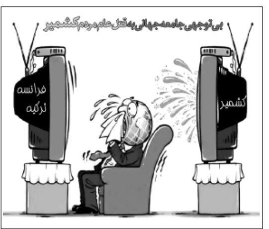
بی‌توجهی جامعه جهانی به قتل عام مردم کشمیر

حالا هر که می‌خواهد باشد، با هر ظاهری! حرف پیامبر خیلی صریح است.