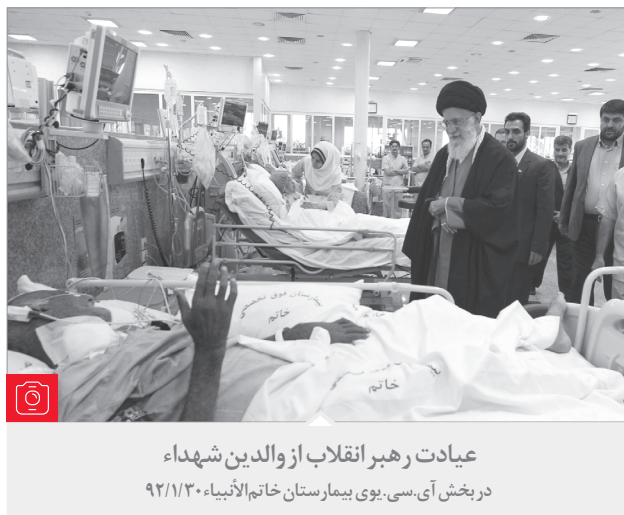
عیادت رهبر انقلاب از والدین شهداء

در بخش آی.سی.یوی بیمارستان خاتم‌الانبیاء ۹۲/۱/۳۰