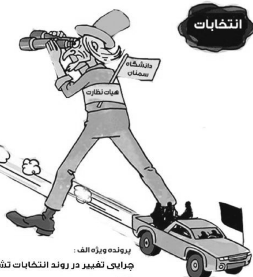
پرونده ویژه الف : چرایی تغییر در روند انتخابات تشکل ها