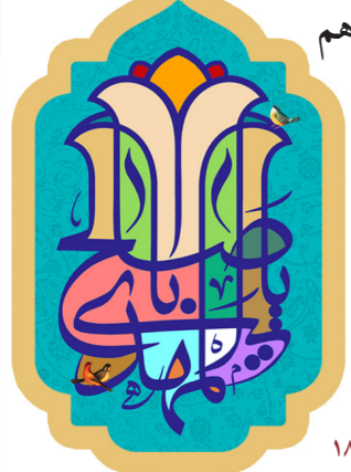
بحار الانوار، ج ۵۳، ص ۱۸۰

پس حالا بیایید تلاش‌مان را بیشتر و واقعی‌تر کنیم. نه فقط رفتارهای فردی، بلکه رفتارهای خانوادگی و اجتماعی‌مان هم باید مهدی‌پسند باشد؛ اگر واقعاً منتظریم...