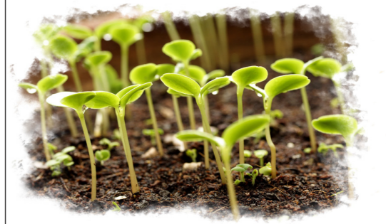
سوره قاف، آیه ۱۱

جالب این است که ما این باران را می‌بینیم و برای آمدنش دعا می‌کنیم و از گیاهانی که به واسطه آن زنده شده، می‌خوریم، اما آخر سر به موضوع معاد که می‌رسیم هزار شک و شبهه می‌آوریم که نکند دروغ باشد! وای بر این ایمان ما!