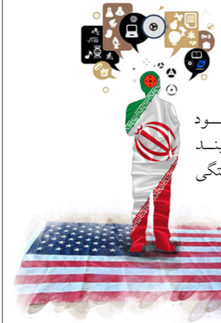
(صحیفه امام، ج ۹، ص ۲۴ - ۲۷)

افسوس که هنوز عده‌ای از روشنفکران نمی‌توانند دست از غرب و یا شرق بکشند؛ و این دو را سرمشق کارهای خود قرار داده‌اند. امیدواریم با تحول فرهنگ حاکم اسلامی، این گروه به خود مشغول و از مردم بریده به خود آیند و اصالت خویش را دریابند و از وابستگی نجات پیدا کنند.