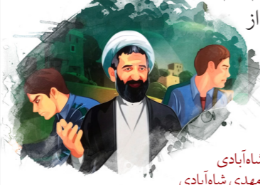
راوی: سعید شاه‌آبادی شهید آیت‌الله مهدی شاه‌آبادی

شهادت آیت‌الله شاه‌آبادی در اوایل ورود به روستای فشم، وقتی سراغ مسجد محل را از اهالی می‌گیرند، مکانی متروکه را نشانشان می‌دهند. با تلاش بسیار پس از دو روز، موفق به گشودن درش می‌شوند! ایشان به همراه فرزند (تنها مأمومشان) تا یک ماه به تنهایی به مسجد می‌رفتند. این جریان بود تا اینکه یک‌شب به سراغ جوان پهلوان و کشتی‌گیر محله می‌روند و با برقراری ارتباط با او و جوانان دیگر، باب دوستی را می‌گشایند. سپس از همسر خود درخواست می‌کنند غذایی تهیه کنند و همراه با جوانان محله چندین شب متوالی به کوهنوردی می‌روند. آرام‌آرام پای آنان را به مسجد باز می‌کنند. تا اینکه پس از مدتی آمدن به مسجد و نماز خواندن یا تنها نماز خواندن، به شهید شاه‌آبادی علاقه‌مند می‌شوند و به ایشان اقتدا می‌کنند.