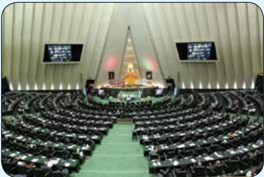
هر دقیقه جلسه علنی مجلس چند میلیون؟

وی اشتباه را امری طبیعی در بهره‌برداری از پروژه‌ها در شهر اصفهان عنوان کرد و گفت: ما همه سعی خود را بر آن داشته‌ایم تا درصد خطاهای پروژه‌ها را به صفر برسانیم و تا اندازه زیادی نیز موفق بوده‌ایم. شهردار اصفهان همچنین به دعوت از شهرداری اصفهان برای حضور در دومین نشست شهرهای خلاق در چین که از ۱۶ تا ۱۹ خرداد برگزار می‌شود اشاره کرد و افزود: این نشست با حضور دبیرکل پونسکو و شهردار پکن برگزار شده و برای نخستین بار است که از شهرداری