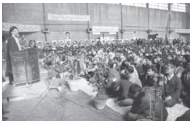
جلسه پرسش و پاسخ دانشجویان در دانشگاه علم و صنعت | ۶۷/۹/۸

افروخته و جنگ‌هایی که آلتا در بسیاری از جاهای دنیا هست، هم‌هاش زیر سر این است. و دنیا را اینها دارند تهدید می‌کنند و هرگز هم اینها سلاح‌هایی که می‌گویند متوقف می‌کنیم و اینها را محدود می‌کنیم به حد، هرگز راست نمی‌گویند. بنابراین، ما باید هر چه فریاد داریم به سر اینها بزنیم. امروز که