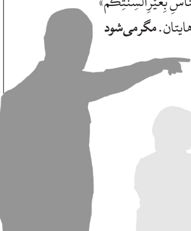
بحار الأنوار (ط - بیروت)، ج ۶۷، ص: ۳۰۹