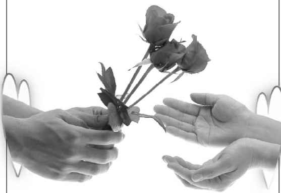
الکافی (ط - دارالحدیث)، ج ۱۱، ص: ۳۱۶

این سخن مرد به همسرش که «دوستت دارم»، هیچ گاه از قلب زن بیرون نمی رود. پس یک مدت طولانی بدون چشم داشت، این ذکر روزانه را بگوتا تأثیرش را ببینی: «عزیزم، دوستت دارم.»