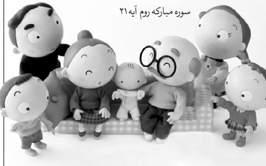
سوره مبارکه روم آیه ۲۱

و از نشانه های او اینکه همسرانی از جنس خودتان برای شما آفرید تا در کنار آنان آرامش یابید، و در میانتان مودت و رحمت قرار داد. ناگفته پیداست وظیفه تک تک ما در حفظ، تقویت و گسترش این حلقه.