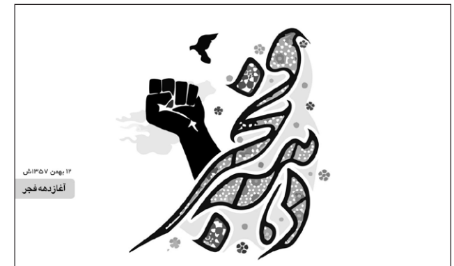
۱۶ بهمن ۱۳۵۷ ش آغاز دهه فجر

والله قسم، من با نخست وزیري بازرگان مخالف بودم ولی او را هم آدم خوبی می دانستم. والله قسم، من رای به ریاست جمهوری بنی صدر ندادم و در تمام موارد نظر دوستان را پذیرفتم.