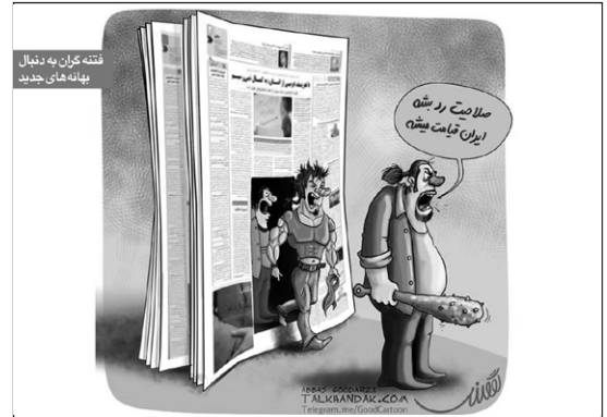
فتنه گران به دنبال بهانه های جدید