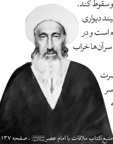
منبع: کتاب ملاقات با امام عصر عجل الله تعالی فرجه الیه ، صفحه ۱۳۷

در دوران جنگ جهانی اول و اشغال ایران توسط قوای انگلیس و روس، مرحوم نائینی خیلی نگران بود از این که کشور دوستداران امام زمان عجل الله تعالی فرجه الیه از بین برود و سقوط کند. شبی به امام عصر عجل الله تعالی فرجه الیه توسل می کند و در خواب می بیند دیواری است به شکل نقشه ایران که شکست برداشته و خم شده است و در زیر این دیوار تعدادی زن و بچه نشسته اند و دیوار دارد روی سر آن ها خراب می شود.