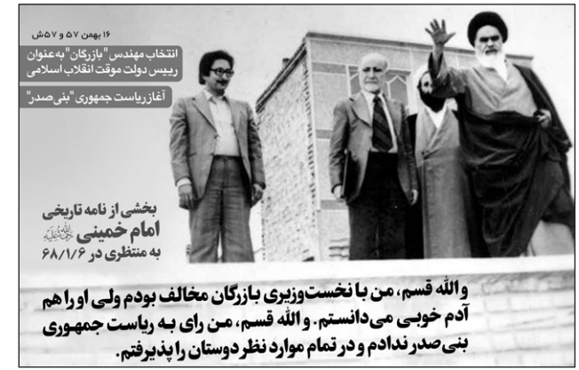
۱۶ بهمن ۵۷ و ۵۷ ش انتخاب مهندس "بازرگان" به عنوان رئیس دولت موقت انقلاب اسلامی آغاز ریاست جمهوری "بی صدر"

ارسال تصاویر شما : sangaremahalle@chmail.ir