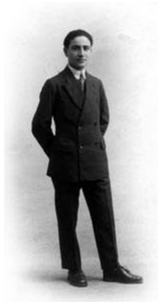
شکل ۲: مرحوم مهدی بازرگان

مهدی بازرگان در سال ۱۲۸۶ در تهران متولد شد. پدرش حاج عباسقلی بازرگان (تبریزی) از تجار دیندار، روشنفکر و سرشناس زمان خود بود. بازرگان تحصیلات ابتدایی را در مدرسه سلطانیه تهران و متوسطه را در دارالمعلمین مرکزی به پایان رسانید و در سال ۱۳۰۶ جزء اولین گروه محصلین ممتاز کشور، برای تحصیل به فرانسه اعزام شد. بازرگان پس از طی دوره مقدماتی و قبولی در کنکور سراسری کشور فرانسه، از بین دانشجویان اعزامی، اولین ایرانی بود که وارد تحصیلات عالی دانشگاهی شد و مورد تشویق وزیر فرهنگ وقت قرار گرفت. در سال ۱۳۱۳ پس از ۷ سال تحصیل در فرانسه به کشور بازگشت و به خدمت نظام وظیفه رفت. در سال ۱۳۱۵ به عنوان اولین دانشیار در دانشکده فنی دانشگاه تهران مشغول به تدریس شد و دو دوره متوالی ریاست دانشکده فنی را به عهده گرفت. در سال ۱۳۳۰، توسط مرحوم دکتر مصدق به ریاست