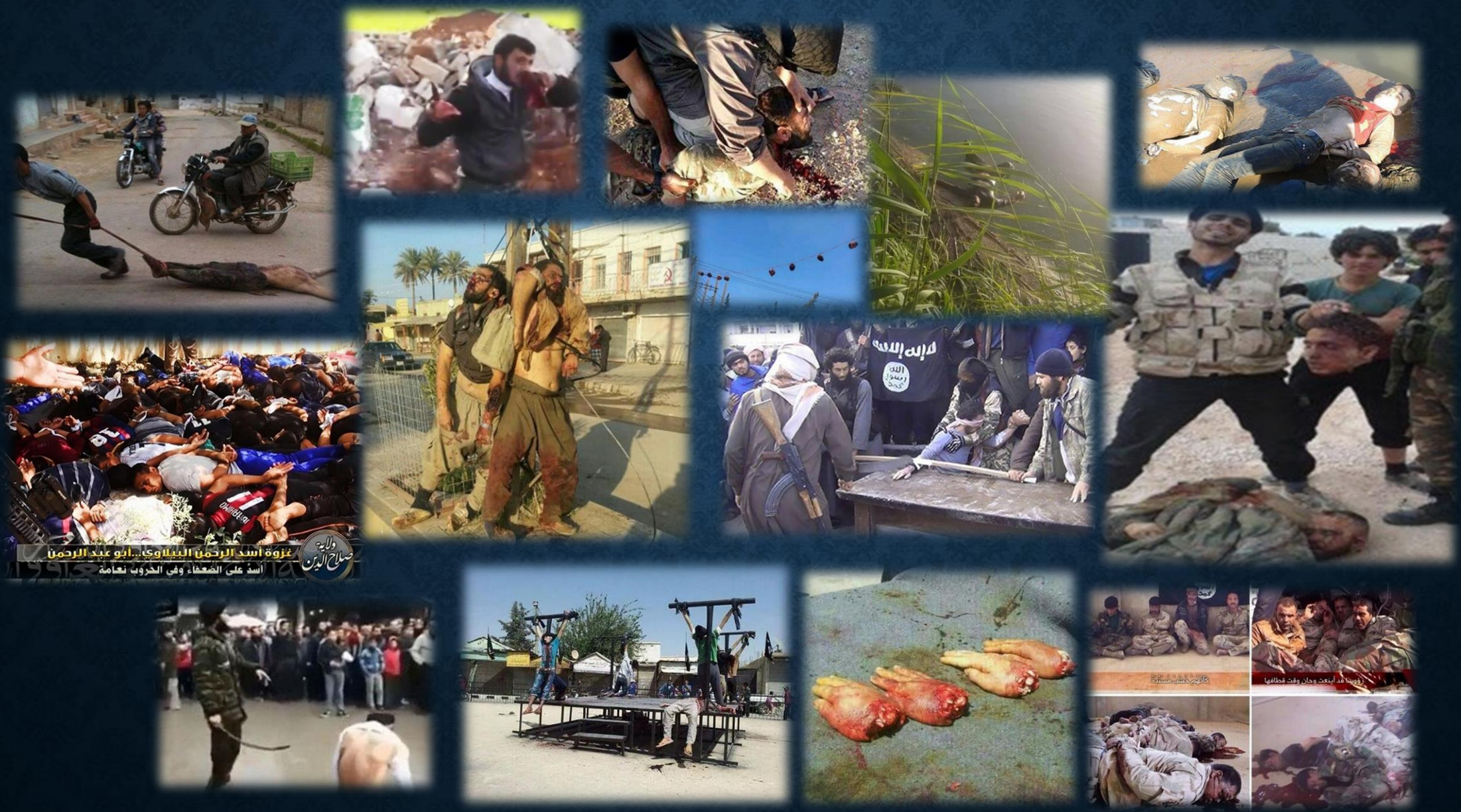
غزوة أسد الرحمن البيلوي... أبو عبد الرحمن أسد على الضعفاء وفي الحروب نعامه صلاح الدين