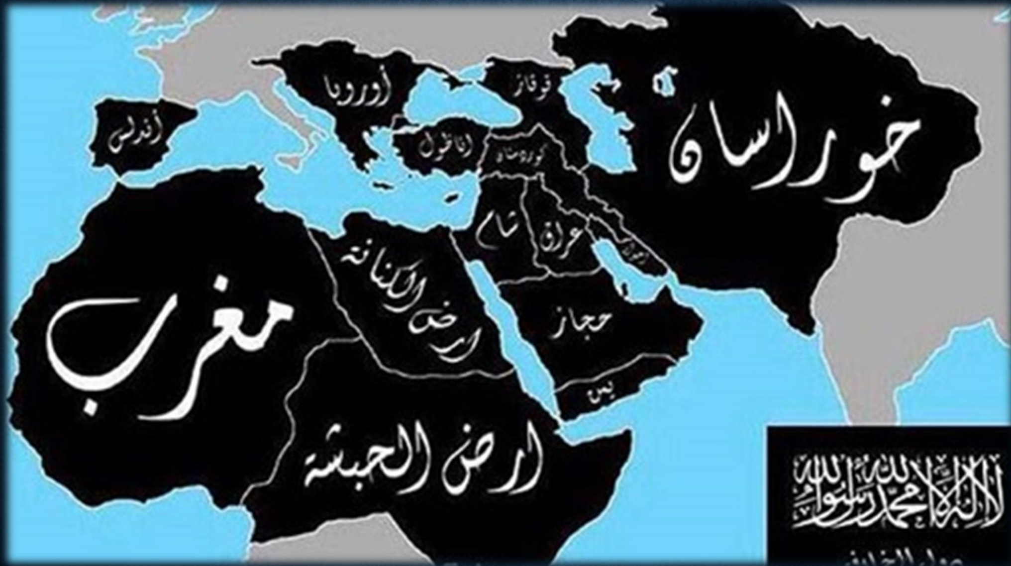
* نقشه ادعایی داعش جهت تشکیل دولت بزرگ اسلامی