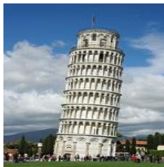
Leaning tower of Pisa

دوست شما دیروز از یک موزه تاریخی دیدن کرده است. او ملیت دو نفر از اشخاص مهم آن موزه و کشور مربوط به دو مکان معروف را نمیداند. از شما خواسته تا آنها را برای او بنویسید (2 نمره)