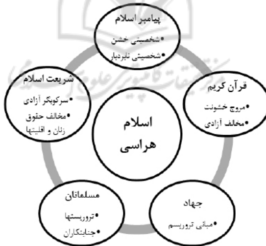
نمودار شماره ۱- دال مرکزی و دالهای شناور اسلام‌هراسی اتاق‌های فکر غربی

در عین حال، همان‌گونه که در نظریه «لاکلاو» و «موفه» تأکید شده، عاملان سیاسی در جبر ساختار محبوس نیستند، بلکه از آزادی عمل کافی برای شکل دادن به ساختار و کنش‌های لازم برخوردارند. اتاق‌های فکر امریکا و انگلیس و کارشناسان آنها، شکل‌دهنده و صورت‌بخش جریان اسلام‌هراسی هستند و نقش پیشرو و عاملیت را در این حوزه ایفا می‌کنند. از سویی، گروه‌های افراطی و تندرو نیز با اقدامات تروریستی -چه در جهان غرب و چه علیه جهان اسلام- به تشدید راهبرد اسلام‌هراسی کمک کرده‌اند و تصویری خشن، نابردبار، جزمی و مخالف هرگونه آزادی از اسلام در افکار عمومی غرب نشان داده‌اند.