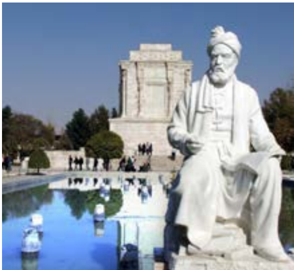
بسی رنج بردم درین سال سی عجم زنده کردم بدین پارسی

در عصر سامانیان زبان و ادب فارسی اوج گرفت. امیران و وزیران ایران‌گرا و فرهنگ‌پرور سامانی زحمات فراوانی برای ترویج این زبان کشیدند. آنان شاعران و نویسندگان فارسی‌گو را تشویق و حمایت می‌کردند. رودکی پدر شعر فارسی در این زمان می‌زیست و مورد حمایت دربار سامانی بود. حکیم ابوالقاسم فردوسی نیز در اواخر دوره سامانی شروع به سرودن شاهنامه کرد. او پس از سقوط سامانیان، شاهنامه را به سلطان محمود غزنوی تقدیم کرد، اما این سلطان، قدر خدمت این شاعر بزرگ را ندانست و این شاعر آزاده را آزرده خاطر ساخت.