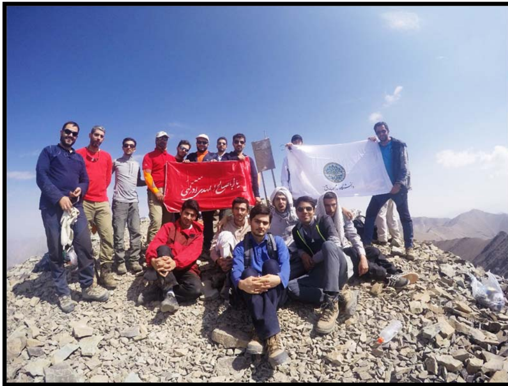
گروه کوهنوردی دانشگاه امام صادق علیه‌السلام بر فراز قله خلنو؛ جمعه ۵ مرداد ماه ۱۳۹۷

حرکت منظم تیم ما در میان کوهستان در آن صبح دل انگیز واقعا زیبا و چشم‌نواز بود و احساس خوبی به خود بچه‌ها منتقل می‌کرد. پس از حدود ۵ ساعت، تمام بچه‌ها از پس قله‌ی سرسخت خلنو برآمدند و در ساعت ۱۰:۴۰ صبح گام برفراز بلندترین قله‌ی استان تهران نهادیم و نام امام صادق علیه‌السلام و حضرت صاحب‌الزمان عجل‌الله‌تعالی‌فرجه‌الشریف را بر فراز قله به اهتزاز در آوردیم.