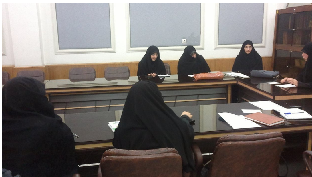
تصویر جلسه هم اندیشی مربیان در تاریخ 27 آذر ماه در فرهنگسرای آینه :