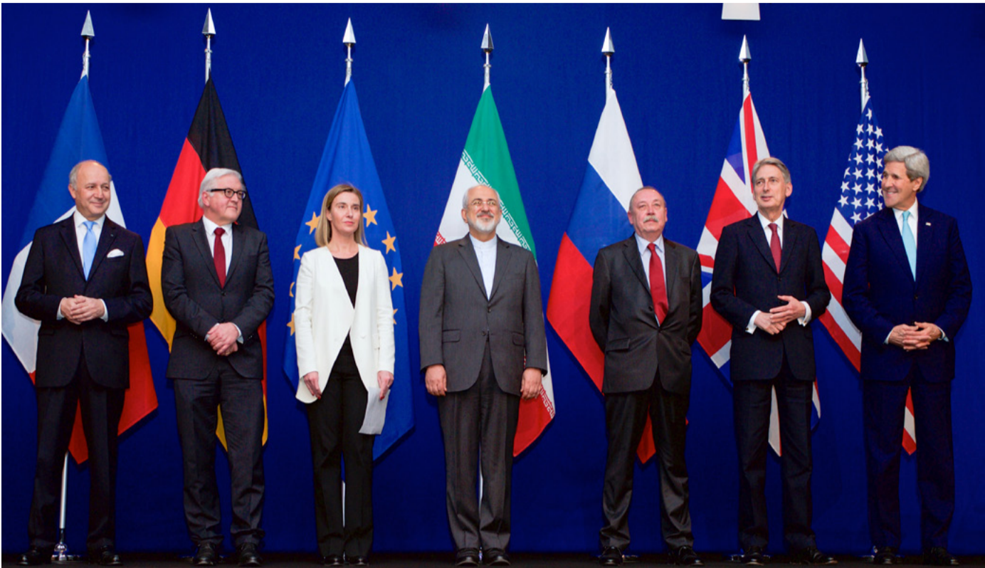
سخنگوی وزارت خارجه آمریکا: