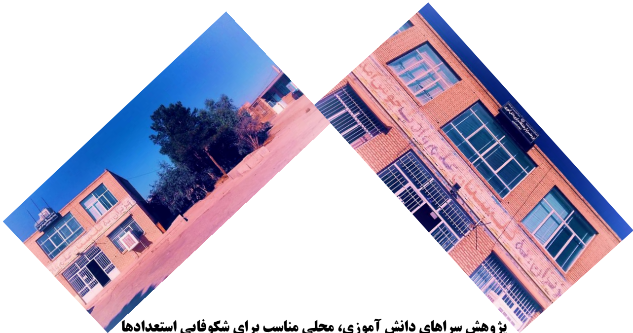
پژوهش سراهای دانش آموزی، محلی مناسب برای شکوفایی استعدادها