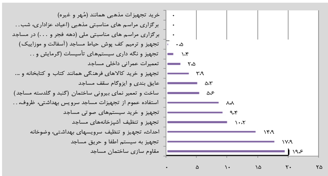
نمودار ۳: اولویت‌بندی مسائل مساجد در شهر تهران

همان‌طور که در جدول فوق مشاهده می‌شود، از نظر پاسخگویان، مقاوم‌سازی ساختمان مساجد به لحاظ امنیت در رتبه نخست و پس از آن تجهیز به سیستم اطفاء حریق مساجد و احداث، تجهیز و تنظیف سرویس‌های بهداشتی، وضوخانه در رتبه‌های دوم و سوم قرار می‌گیرند. نمودار زیر آمار فوق را نشان می‌دهد.