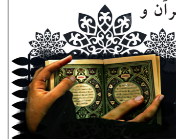
محمد ﷺ آیه ۲۴

چه شبی مهم تر از امشب برای اینکه ما برگردیم به قرآن و آشتی کنیم با این کتاب خدا؟