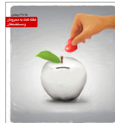
کجه اتفاق در او خدا در نظر لایزال داری پاداش و ثواب است اما در ماه مبارک رمضان داری فضیلت بزرگی است.

• در این بخش می توانید چند طرح مناسبتی این هفته را مشاهده کنید. برای این هفته در تارنمای masjednama.ir پوسترهایی با موضوع هفته کمک به محرومان و مستضعفان، ولادت سبط اکبر، امام حسن مجتبی (ع) شهادت برادر «رسول منتظری» (مجید منتظری) دیپلمات ایرانی در بوسنی و هرزگوین، درگذشت حمید سبزواری، «پدر شعر انقلاب» و سراینده آثار مشهور و ماندنی دوران انقلاب و دفاع مقدس، دومین شب قدر، شهادت مظلومانه حضرت امیرالمؤمنین امام علی (ع) در کوفه، قرار گرفته است.