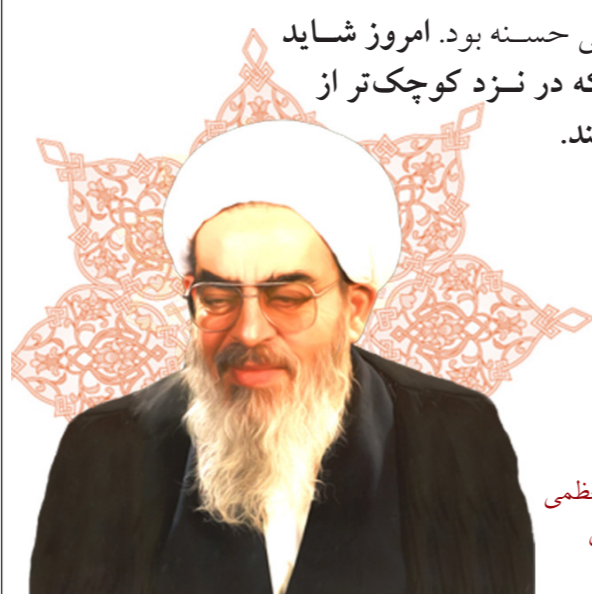
منبع: شیعه آنلاین ۲۶ خرداد، درگذشت آیت الله العظمی حاج شیخ محمد فاضل لنکرانی (ش ۱۳۸۶)

واقعاً این ویژگی، صفتی حسنه بود. امروز شاید کمتر فردی را یافت که در نزد کوچک تر از خودش این گونه رفتار کند.