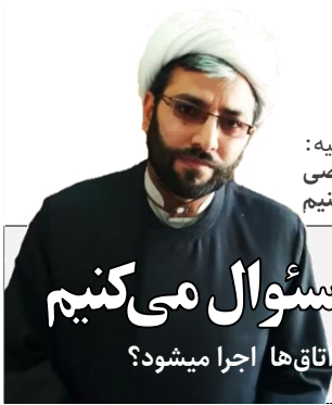
دکتر سلطانیه: اگر اکثریت افراد، از اتاق خود راضی باشند طرح را اجرا نمی‌کنیم