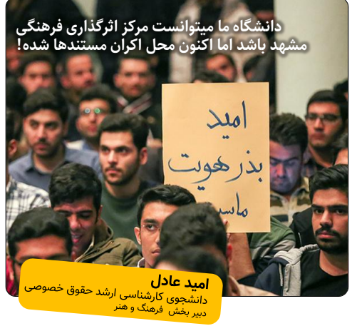
دانشگاه ما نمیتوانست مرکز اثرگذاری فرهنگی مشهد باشد اما اکنون محل اکران مستندها شده!