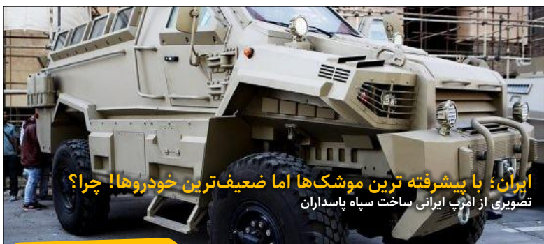
ایران؛ با پیشرفته‌ترین موشک‌ها اما ضعیف‌ترین خودروها! چرا؟ تصویری از اژدر ایرانی ساخت سپاه پاسداران