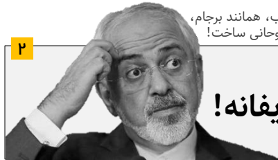
استعفای بیگانه وزیر مصدق مآب، همانند برجام، شکست مفتضحانه‌ای برای روحانی ساخت!