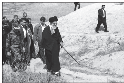
● تذکره یاسیری در خاطرات؟ | فتح‌المبین: ۸۹/۱۱

سوم: این روزها، دشمنان انقلاب از ادبیات سیاسی "میانرو- تندرو" برای تقسیم‌بندی مردم ایران و رسیدن به مقصود خود استفاده می‌کنند. «آنها می‌گویند تندرو، منظورشان کسانی است که در راه انقلاب مصمم‌تر و پایدارترند؛ حزب‌اللهی‌ها را می‌گویند تندرو.» ۹۴/۱۲/۵؛ از نظر دشمن، تندروها یا بهتر بگوییم نیروهای مؤمن حزب‌اللهی و بسیجی «خاکریزهای مستحکم» انقلاب هستند که با وجود آنها نمی‌توانند پروژه‌ی «نفوذ» را تکمیل کنند. پس «یکی از چیزهایی که مکمل این نفوذ است، تخطئه‌ی کسانی است که بر اصالت‌ها، بر نگاه درست، بر ارزش‌ها پای می‌فشارند.» ۹۴/۹/۴؛ از نظر دشمن، «میانرو [هم] کسی است که در مقابل آنها تسلیم باشد.» ۹۴/۱۲/۵؛ یعنی همان «خاکریز نرم» مثل خاکریز نرم نباشید که دشمن از هر جا خواست بتواند در شما نفوذ کند؛ مستحکم باشید.» ۹۳/۱۰/۱۹؛ در حالی که از نظر اسلام، «در مقابل میانه‌رو تندرو نیست؛ در مقابل میانه‌رو، منحرف است. آن کسی میانه‌رو نیست که منحرف از راه و منحرف از جاده است؛ اما در جاده، بعضی‌ها تندتر می‌روند و بعضی‌ها کندتر می‌روند. تند رفتن در صراط مستقیم چیز بدی نیست، سَابِقُوا إِلَى مَغْفِرَةٍ مِّن رَّبِّكُمْ؛ جلوتر بروید.» ۹۴/۱۲/۵؛ باید نقشه‌ی دشمن و ادبیات آن را شناخت. و گرنه ممکن است برخی افراد و جریان‌ها از جاده‌ی حق منحرف شوند و کشور را نیز دچار انحراف کنند. جوان مؤمن انقلابی همان خاکریز مستحکم انقلاب است که می‌تواند از انحراف در انقلاب و اصول آن جلوگیری کند. الفاظ معانی خودشان را دارند و معنایی سبب می‌شوند که رفتارها تحت تاثیر قرار بگیرد. عدالتخانه در اثر تکرار ادبیات سیاسی دشمن به مشروطه تبدیل شد و بعد هم از مسیر خودش منحرف شد. انحراف از مسیر حق، نتیجه تکرار ادبیات سیاسی دشمن است. ●