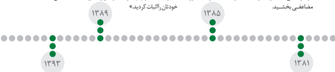
● بادست پیران‌شاء... | یادمان شهدای شوق کارون: ۹۳/۱/۶

دهلاویه یادمان چمران است. «همت شما مردم، غیرت جوانان مسلمان از سراسر کشور و حمیت و ایمان مرد وزن این سرزمین، محاسبات آنها را از ریشه باطل کرد. جانمایی در اینجا قربان اهداف بلند اسلامی شدند؛ که این شهید عزیز ما - شهید چمران - یکی از نمونه‌های برجسته‌ی آن است.» رهبر انقلاب، در این بازدید که جمع کثیری از مردم خوزستان حضور داشتند، در میان مردم و متأثر از حال و هوای معطر از شمیم پاک شهید، روی صحبت‌هایشان را به سوی استکبار گران عالم قرار دادند: «استکبار جهانی بداند که زن و مرد این مرز و بوم در کوره‌های حوادث، همچون فولاد آبدیده شده‌اند و پاسداری از اسلام و پرچم برافراشته‌شده‌ی اسلام در این سرزمین را که عمق راهبردی ملت ایران در جهان اسلام است برای خود یک رسالت تاریخی می‌داند.» حضرت آیتا... خامنه‌ای، بخشی از سخنانشان را هم به زبان عربی بیان کردند و برای آزادی مردم عراق از شر اشغالگران آمریکایی دعا کردند و این سخنران به عرب‌زبانانی که برای بازدید دهلاویه آمده بودند شور مضاعفی بخشید.