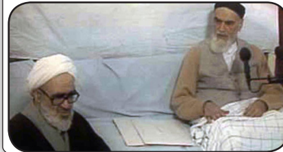
نامه امام (ره) در پی عزل منتظری از قائم مقام رهبری، ۱۳۶۸/۱/۶

«والله قسم، من از ابتدا با انتخاب شما مخالف بودم. شما مشغول به نوشتن چیزهایی می‌شوید که آخرتتان را خراب‌تر می‌کند. اگر اینگونه کارهایتان را ادامه دهید، مسلماً تکلیف دیگری دارم و می‌دانید که از تکلیف خود سرپیچی نمی‌کنم... تاریخ اسلام پر است از خیانت بزرگان به اسلام. از خدا می‌خواهم که به پدر پیر مردم عزیز ایران صبر و تحمل عطا فرماید و او را بخشیده و از این دنیا ببرد تا طعم تلخ خیانت دوستان را بیش از این نچشد.»