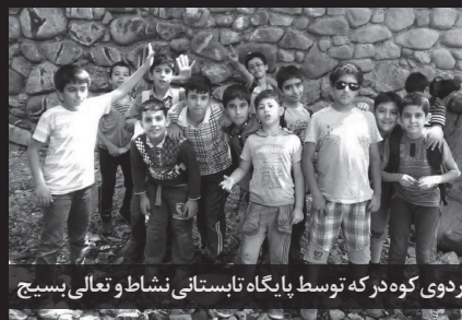
اردوی کوه در که توسط پایگاه تابستانی نشاط و تعالی بسیج