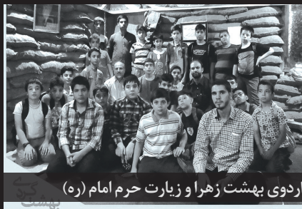
اردوی بهشت زهرا و زیارت حرم امام (ره)