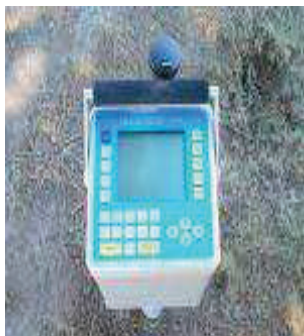
شکل ۲. دستگاه ثقل سنج نسبی CG3

هر شکل و نموداری باید در داخل یک جدول دارای دو سطر و یک ستون درج شود. در سطر اول شکل یا نمودار به صورت وسط‌چین و در سطر دوم عنوان شکل با فونت BNazanin (10 pt.) باید درج شوند. شکل و نمودار در داخل متن و پس از جایی که به آنها ارجاع می‌شود، گنجانده می‌شود. نمودار و شکل می‌تواند به صورت رنگی و یا سیاه و سفید باشند ولی به گونه‌ای که جزئیات آنها قابل تشخیص باشد. اگر شکل یا نمودار مرجع دارند، بایستی شماره مرجع در داخل کروش و در انتهای عنوان ذکر شود. توجه شود که خود جدول نیز باید در موقعیت وسط‌چین نسبت به طرفین کاغذ قرار گیرد و برای چند تا شکل در کنار هم باید تعداد ستون‌های جدول را افزایش داد. کلیه خطوط جدول باید محو شوند. هر شکل و نمودار با یک سطر خالی (به اندازه فونت BNazanin (6 pt.) ) از متن ماقبل و مابعد آن قرار گیرد.