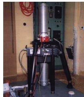
شکل ۱. دستگاه ثقل سنج مطلق FG5 [۲]