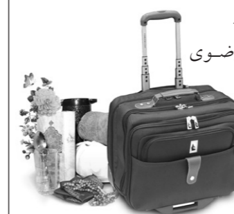
سفر نذر روزه کند.

برای این‌که بتواند در سفر روزه بگیرد، باید قبل از سفر نذر روزه کند.