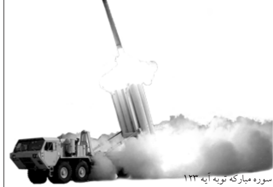
سوره مبارکه توبه آیه ۱۲۳