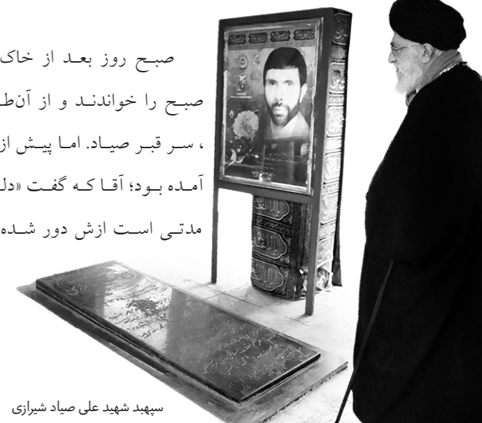
سپهد شهید علی صیاد شیرازی

صبح روز بعد از خاک سپاری، خانواده‌اش نماز صبح را خواندند و از آن طرف رفتند بهشت زهرا (ع.ا.س)، سر قبر صیاد. اما پیش از آن‌ها شخص دیگری هم آمده بود؛ آقا که گفت «دلَم برای صیادم تنگ شده، مدتی است ازش دور شده‌ام.»