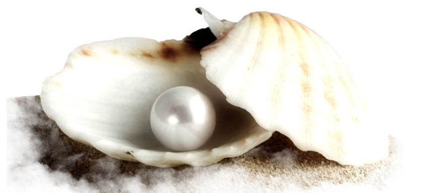
کتاب مسئله حجاب، ص ۷۶ و ۷۷

حجاب در اسلام از یک مسئله کلی تر و اساسی تر ریشه می گیرد و آن این است که اسلام می خواهد انواع التذاذهای جنسی، چه بصری و سمعی و چه انواع دیگر به محیط خانوادگی و در کادر ازدواج قانونی اختصاص یابد، اجتماع منحصرأ برای کار و فعالیت باشد. برخلاف سیستم غربی عصر حاضر که کار و فعالیت را با لذت جویی های جنسی به هم می آمیزد، اسلام می خواهد این دو محیط را کاملاً از یکدیگر تفکیک کند.