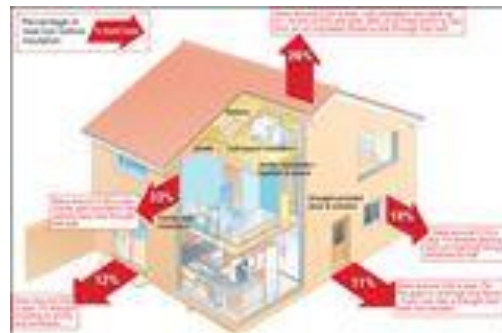
شکل 1- نمونه شکل داده شده

گونه ای که در صورت چاپ سیاه و سفید رنگها و جزئیات آنها قابل تشخیص باشد. شکل ها در داخل متن و در جایی که به آنها ارجاع می شود، درج گردند. ذکر واحد کمیت ها در شکل ها الزامی است. در متن مقاله باید به همه شکل ها ارجاع شود. در تهیه شکل ها توجه کنید که اندازه اعداد، با قلم نازنین 10pt باشد تا پس از درج در مقاله، کاملاً واضح و (legend) واژه ها، کمیتها و راهنمای منحنیها خوانا باشند. قبل و بعد از هر شکل، یک سطر فاصله ایجاد کنید. (توجه شود که خود شکل ها و نمودارها نیز، همانند جدولها باید در موقعیت وسط چین نسبت به طرفین کاغذ قرار گیرند). یک نمونه شکل و نمودار مطابق دستورالعمل در زیر آمده است.