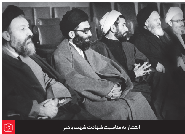
انتشار به مناسبت شهادت شهید باهنر

همان چیزی است که در قانون اساسی آمده است. رهبری، سیاستگذار کلی نظام محسوب می‌شود؛ یعنی همه قوای سه‌گانه باید در چارچوب سیاست‌های رهبری برنامه‌ریزی کنند و سیاست‌های اجرایی خودشان را تنظیم نمایند. حرکت و قواره‌ی کلی نظام باید در چارچوب سیاست‌هایی باشد که رهبری معین می‌کند. این مهم‌ترین مسؤولیت رهبری است. ۷۹/۱۲/۲۲ وظیفه‌ی رهبری آنجایی است که احساس کند یک حرکتی دارد انجام می‌گیرد که این حرکت، مسیر نظام را دارد منحرف می‌کند. اینجا وظیفه‌ی رهبری است که بیاید در میدان و به هر شکلی که ممکن است بایستد و نگذارد؛ ولو مورد جزئی باشد. ● ۹۵/۴/۱۲