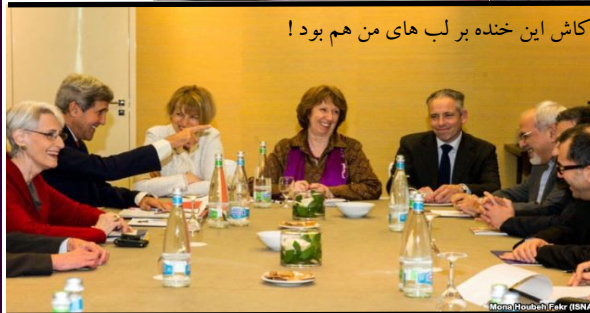
کاش این خنده بر لب های من هم بود!