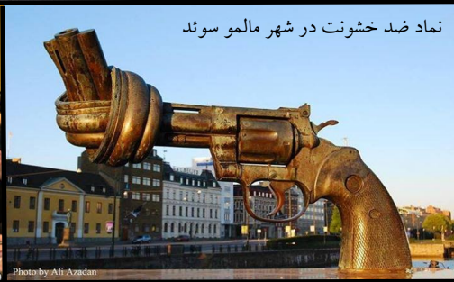
نماد ضد خشونت در شهر مالمو سوئد