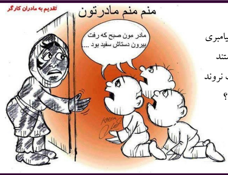
تقدیم به مادران کارگر