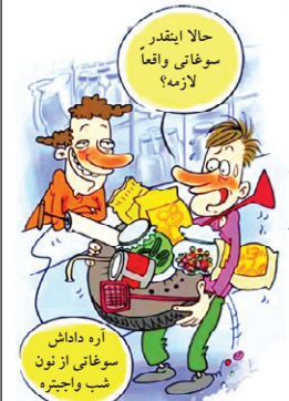
اره داداش سوغاتی از نون شب واجبتره