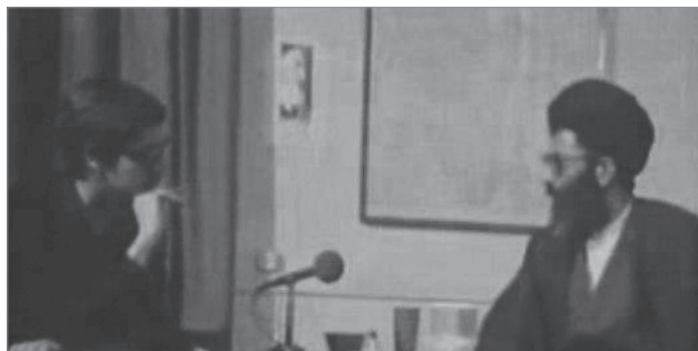
بازدید آیت‌الله خامنه‌ای از لانه جاسوسی آمریکا و صحبت با یکی از جاسوسان آمریکایی