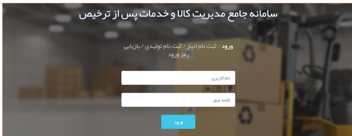
تصویر شماره ۱- ورود به سامانه

چنانچه در سامانه "پنجره واحد تجارت فرامرزی" حساب کاربری داشته باشید؛ می توانید با همان نام کاربری و کلمه عبور وارد سامانه "مدیریت کالا و خدمات پس از ترخیص" شوید و نیاز به دریافت نام کاربری جداگانه برای ورود به آن سامانه نمی باشد. در غیر اینصورت جهت ثبت نام با واحد پشتیبانی تماس حاصل نمایید.